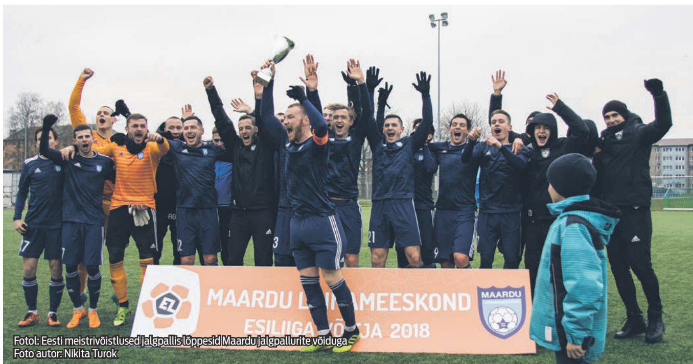
Fotol: Eesti meistrivõistlused jalgpallis lõppesid Maardu jalgpallurite võiduga.

Eesti meistrivõistlused jalgpallis lõppesid Maardu jalgpalliklubi (FC Maardu Linnameeskond) vaieldamatu võiduga. Klubi jalgpallurid kindlustasid teist aastat järjest endale meistrivõistluste esiliigas esikoha. Sel aastal tõusis võistkond liidripositsioonile ja rebis end vastastest ette 17 punktiga , tagades endale esikoha 6 vooru enne kõigi matšide lõppemist!