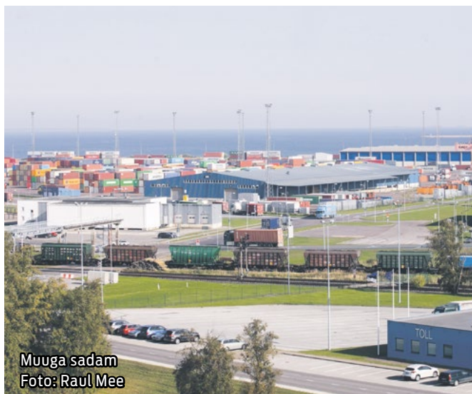
Muuga sadam

2019. aastal alanud Rail Baltica projekteerimistööd Harju maakonnas lõpevad tänaste plaanide kohaselt 2022. aasta alguses.