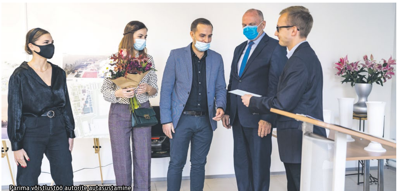
Parima võistlustöö autorite autastamine