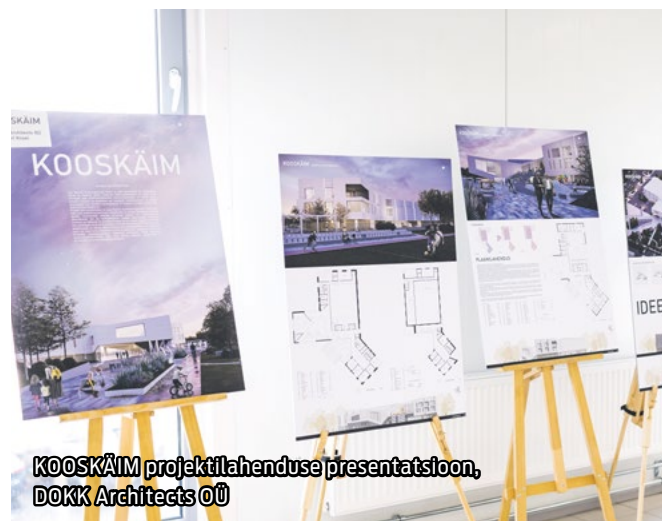
KOOSKÄIM projektilahenduse presentatsioon, DOKK Architects OÜ

Žürii liikmete sõnul õnnestus võidutöö autoritel pöimida esinduslikkust argise asjalikkusega – tegemist on hea ja Maardut linnalises kontekstis kõnetava lahendusega. Hoone plaanilahendus on funktsionaalne ning fuajee on esinduslik ja muljetavaldav, avatud õhuruumiga ja trepistikuga. Välisruum on detailselt läbi lahendatud ning on paljude erinevate kasutusvõimalustega ja tegevuste-