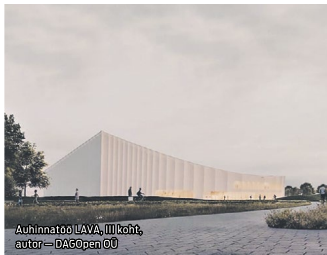
Auhinnatöö LAVA, III koht, autor – DAGOpen OÜ