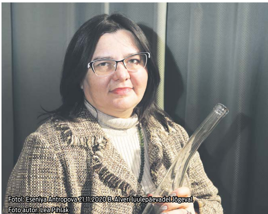
21.11.2020 B. Alveri luulepäevadel Jõgeval