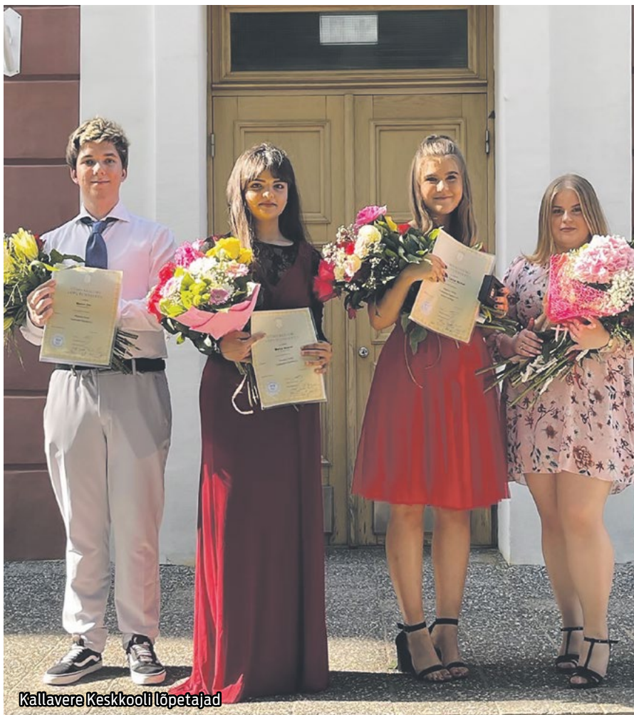
Kallavere Keskkooli lõpetajad

Kui rääkida nüüd põhikooli või gümnaasiumi astme lõpetajatest, siis erinevalt eelmisest aastast tuli sellel aastal sooritada lõpueksamid põhikoolis. Gümnaasiumi astmes olid eksamid vabatahtlikud. Põhikooli lõpetajad sooritasid kõik kolm eksamit. Tulemustes on näha, et pikk distantsope on jätnud oma mõjutuse. Tulemused olid võrreldes eelnevate aastatega veidi madalamad. Kuid oli ka neid, kes sooritasid eksamid peaaegu maksimum punktidele. Gümnaasiumi astme õpilased tegid otsuseid vastavalt oma tulevikuplaanidele ja vajadustele. Sellega arvestades, loobusid õpilased ainult ühest eksamist. Tulemused olid ootuspärased ning parimad küündisid 80 punkti.