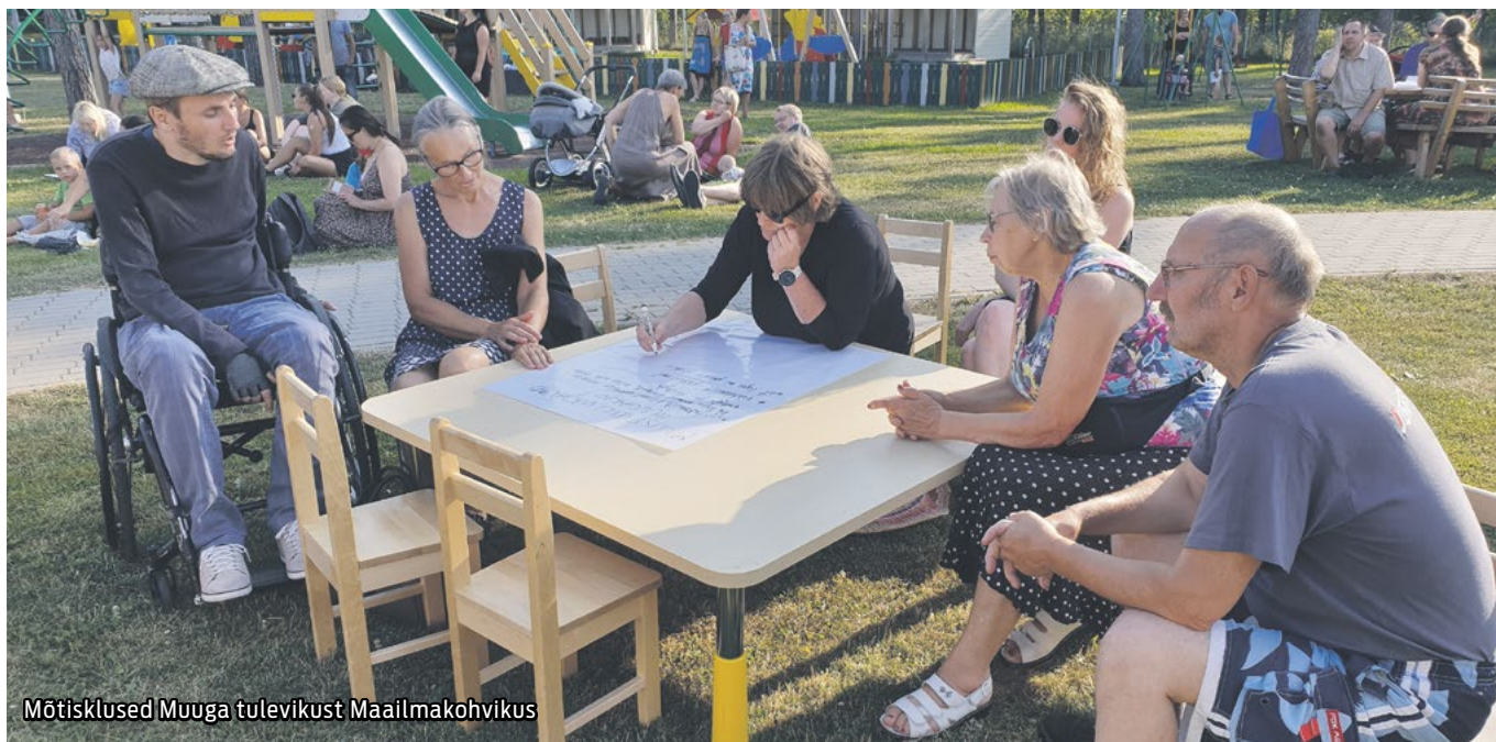
Mõtisklused Muuga tulevikust Maailmakohvikus

Maardu linnapäeva tähistamise raames toimus Muugal Muuga kohvikute- ja kogukonnapäev . Sel aastal toimus see uues ja huvitavas formaadis ning kõik said leida endale meelepärast tegevust.