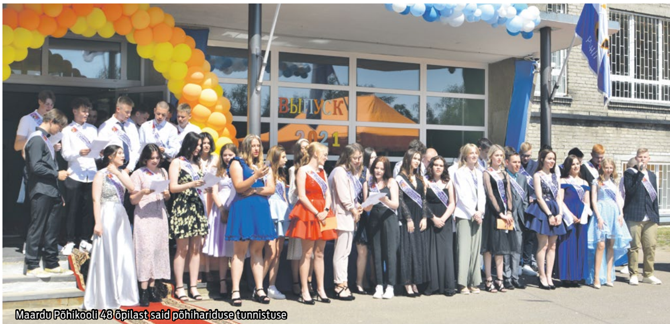
Maardu Põhikooli 48 õpilast said põhihariduse tunnistuse