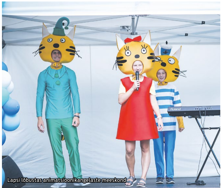
Lapsi lõbustas animatsioonikangelaste meeskond

Laval oli ette valmistatud huvitav ja mitmekülgne kava: peo kõige väiksemad artistid – tantsustuudio Dream Power lapsed – tantsisid kuul-