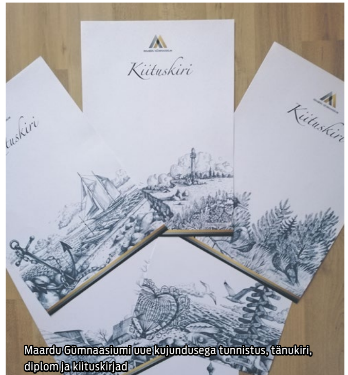
Maardu Gümnaasiumi uue kujundusega tunnistus, tänukiri, diplom ja kiituskirjad

Palju õnne kõigile lõpetajatele! Head suvepuhkust!