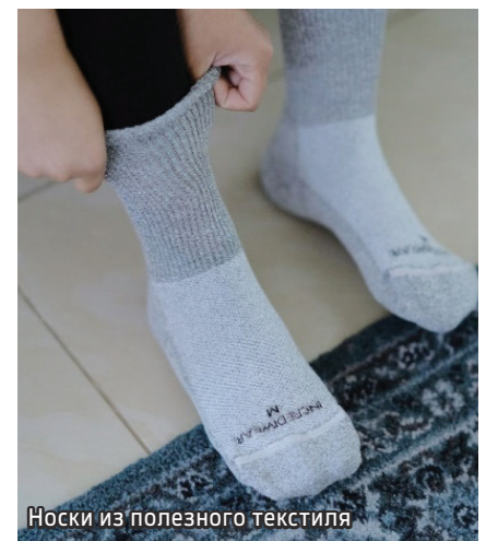
Носки из полезного текстиля