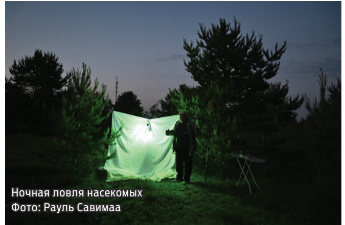
Ночная ловля насекомых