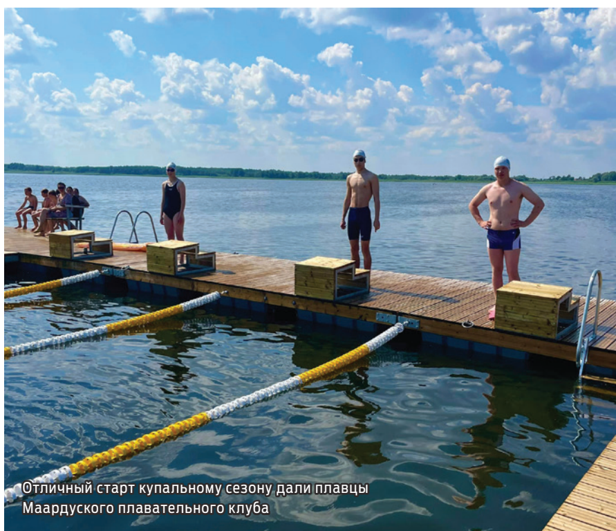
Отличный старт купальному сезону дали пловцы Маардуского плавательного клуба

30 июня на Маардуском озере состоялось торжественное открытие бассейна под открытым небом, что стало хорошей новостью для всех любителей купания. Теперь жители Маарду могут в полной мере наслаждаться летними радостями, посетив новый бассейн.