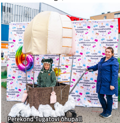
Perekond Tugatovi õhupall

Kohtumiseni 2023. aastal seitsmendal lastetranspordi paraadil!