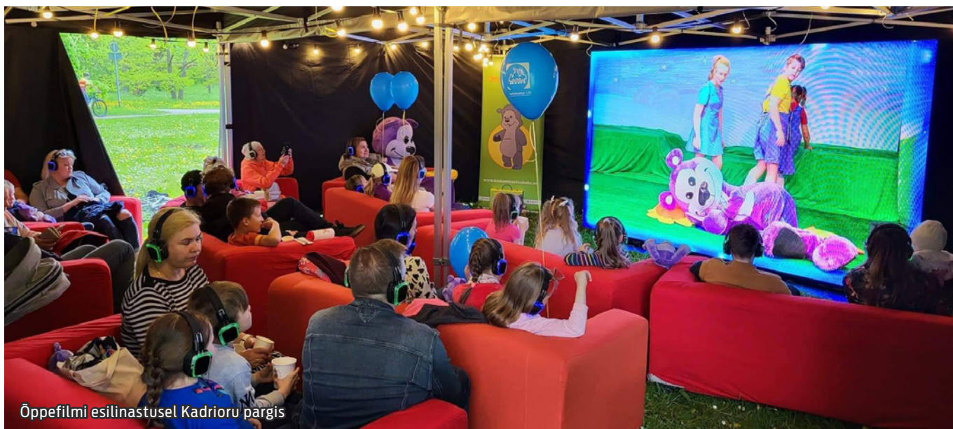
Õppefilmi esilinastusel Kadrioru pargis