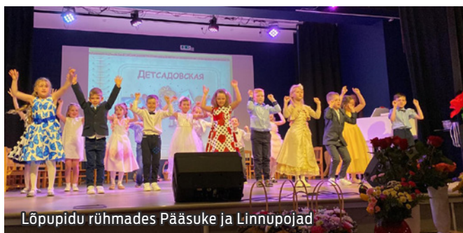
Lõpupidu rühmades Pääsuke ja Linnupojad

Ja nüüd on käes lahkumistund – lõpupidu. Väikestest põngerjatest on saanud tõelised esimese klassi lapsed. Neid ootab ees uus ning sugugi mitte lihtne koolielu.