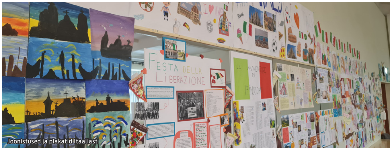
Joonistused ja plakadid Itaaliast

Meie soov on jätkata tugevat koostööd, andes teie õpilastele kõik võimalused itaalia keele praktiseerimiseks ja