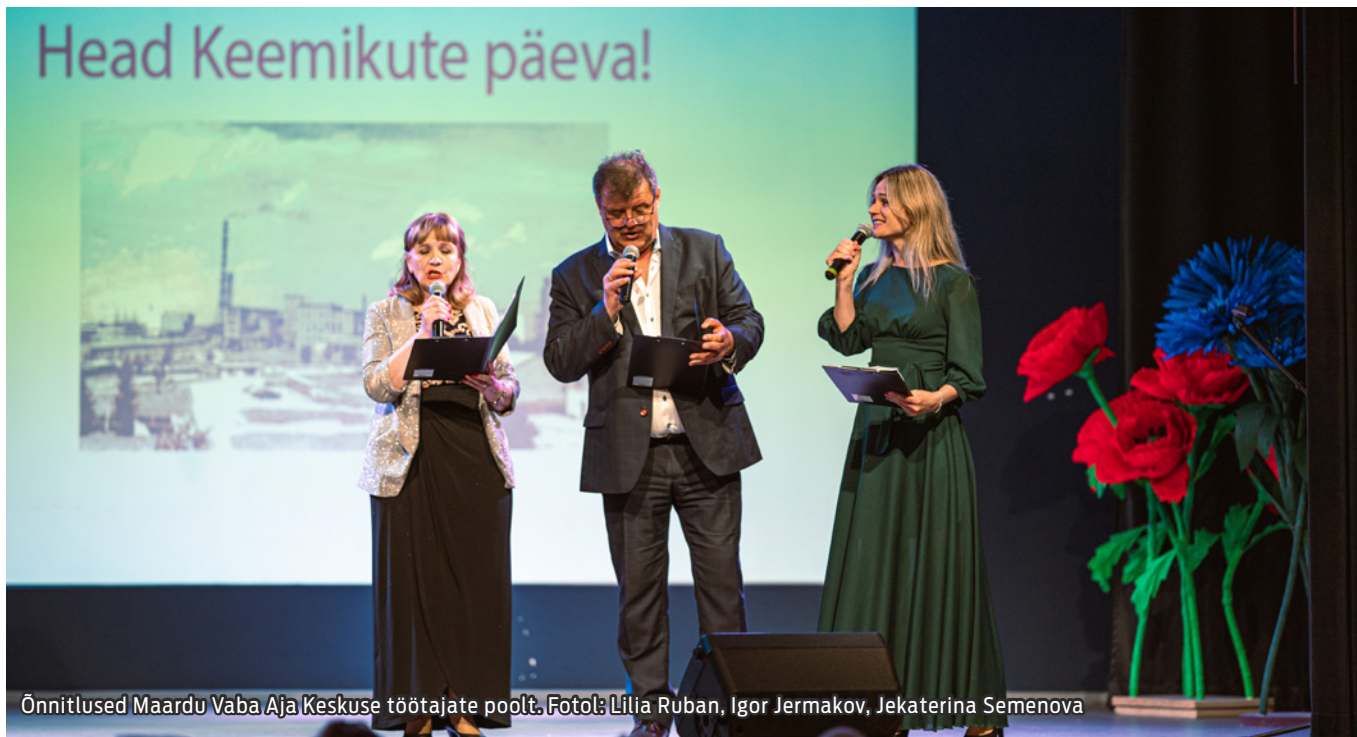
Õnnitlused Maardu Vaba Aja Keskuse töötajate poolt.