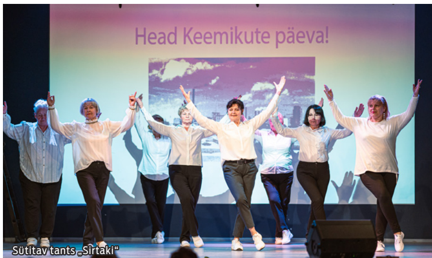
Sütitav tants „Sirtaki“

Erilise soojusega võttis publik vastu liigutava minilavastuse, milles osalesid stuudio Veer & špaga (juhendaja Jessenia Antropova) näitlejad. Näitlejad kehastasid andekalt keemiatehase noorte tööliste rolle ning saalis istujad tundsid lavastuses esitatud noorte tööliste kujudes ära iseend ja oma endisi kolleege. Saal katkestas näitlejate esinemist korduvalt aplausiga.