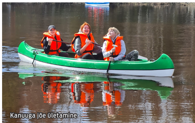
Kanuuga jõe ületamine

Paljude jaoks on maastikul orienteerumine muutunud