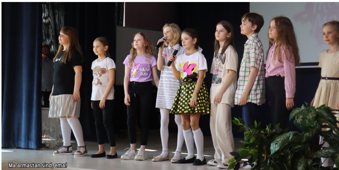
Ma armastan sind, ema!