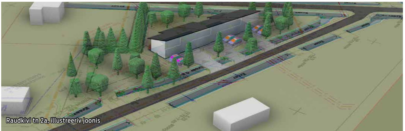
Raudkivi tn 2a, illustreeriv joonis