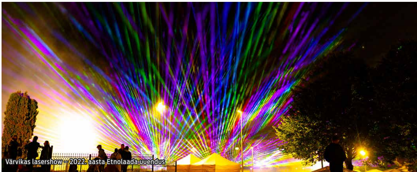
Värvikas lasershow – 2022. aasta Etnolaada uuendus