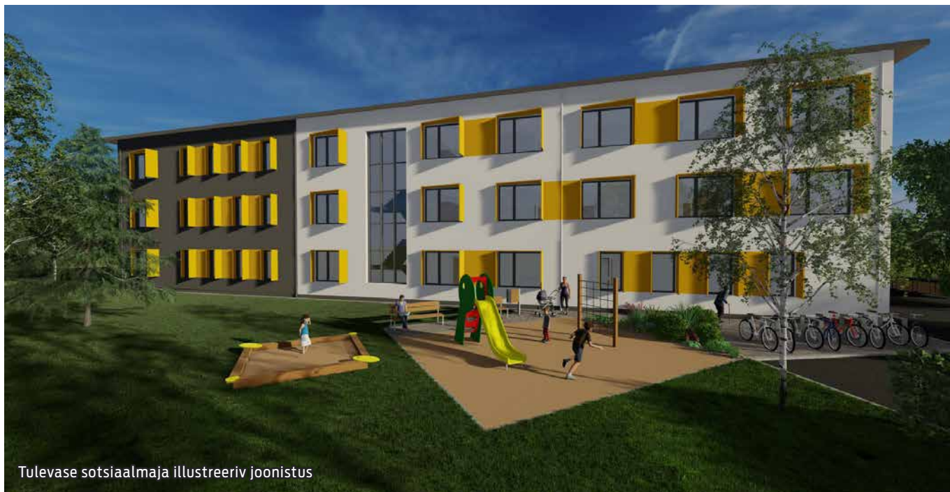
Tulevase sotsiaalimaja illustreeriv joonistus

Septembri esimestel päevadel algas kauaoodatud Maardu uue sotsiaalimaja ehitus, mille hoone saab olema veelgi mugavam ja kaasaegsem. Ehituse lõppedes vastab hoone kõikidele ohutusnõuetele ning tagab sotsiaalimaja elanike ja personali turvalisuse ja mugavuse.