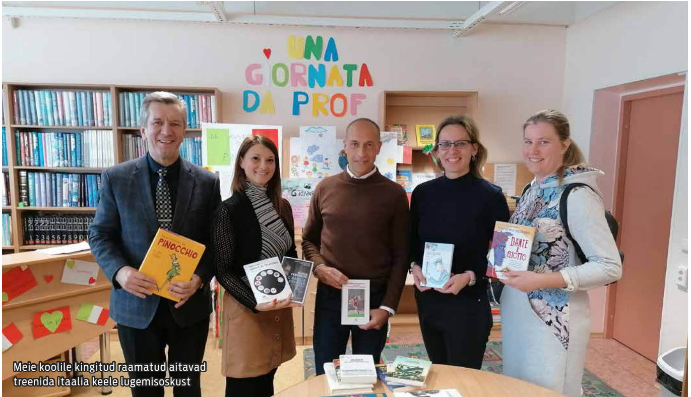
Meie koolile kingitud raamatud aitavad treenida Itaalia keele lugemisoskust

Oktoobri teises pooles peetaval rahvusvahelisel itaalia keele nädalal toimus Maardu Gümnaasiumis projekti „Lugejapesa“ raames ettelugemisüritus „Üks päev õpetajana“ („Una giornata da prof“). Ürituse korraldasid itaalia keele kursusel osalenud gümnaasiumiõpilased. 10.-12.klassi õpilased esitlesid edukalt oma uurimistöid õpetajatele, klassikaaslastele ja meie kooli külastanud Itaalia saatkonna esindajatele.