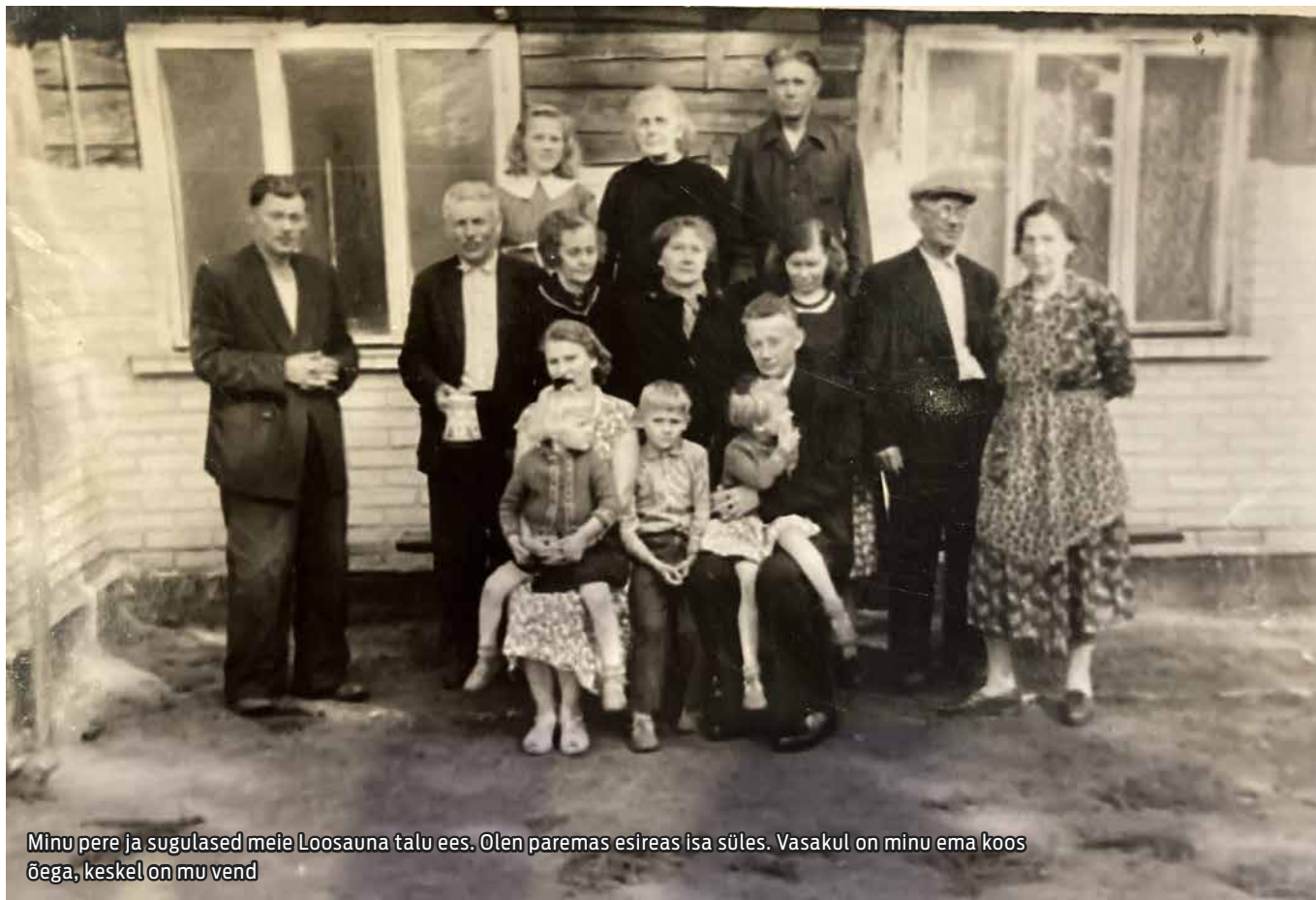
Minu pere ja sugulased meie Loosauna talu ees. Olen paremas esireas isa süles. Vasakul on minu ema koos õega, keskel on mu vend

Tahaksin teile rääkida õnnelikust lapsepõlvest armastava pere ringis, jagada mälestusi oma elust kodulinnas.