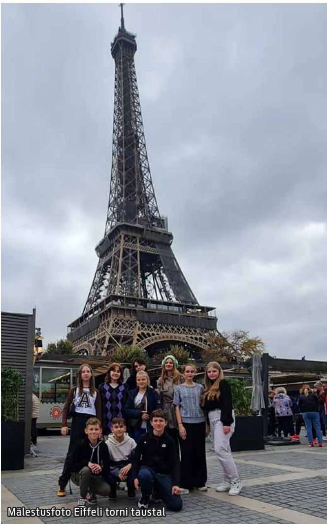
Mälestusfoto Eiffeli torni taustal

Maardu Gümnaasiumi inglise keele õpetaja