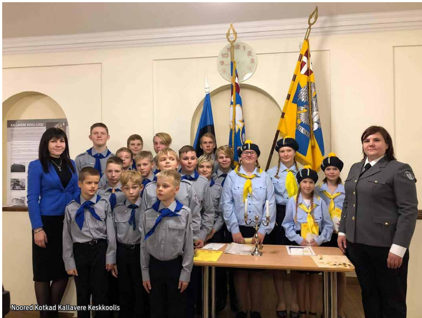
Noored Kotkad Kallavere Keskkoolis