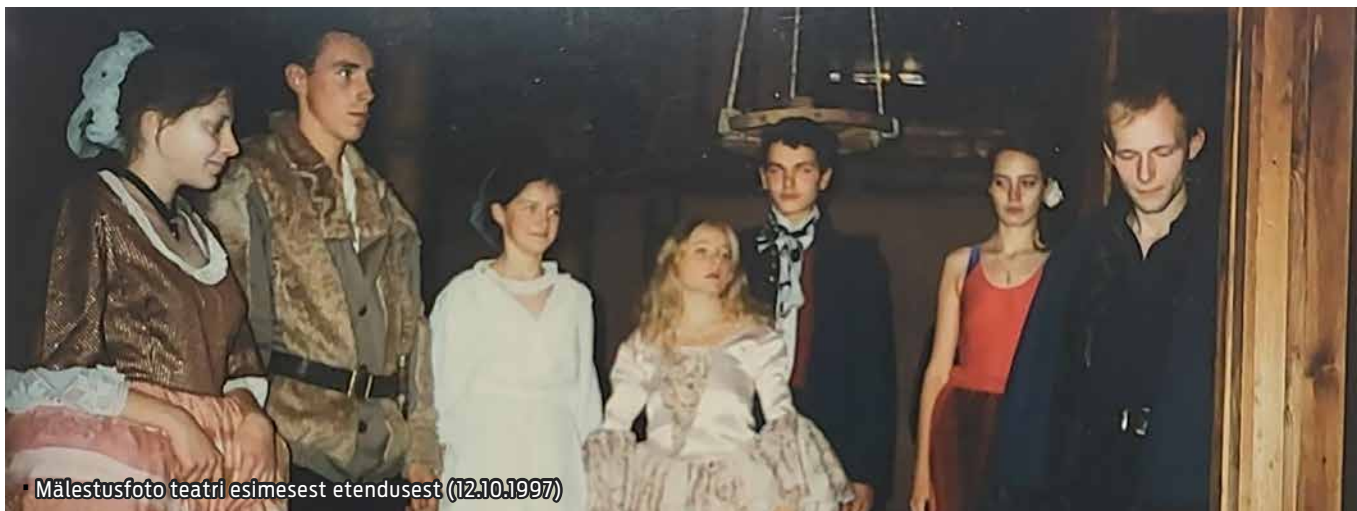
• Mälestusfoto teatri esimesest etendusest (12.10.1997)

Novembri alguses toimus Maardu Rahvamajas XV rahvusvaheline teatrifestival „Minu teater – minu kapriis“, mis sai 2009. aastal alguse Maardu linnast. Festivalil osalesid teatrikollektiivid Tallinnast, Narvast, Kohtla-Järvelt, Alitusest (Leedu). Nad esitasid oma näidendeid, mis on loodud erinevates žanrites: klassika, romantika, eepos, fantasmagooria ja muusikal.