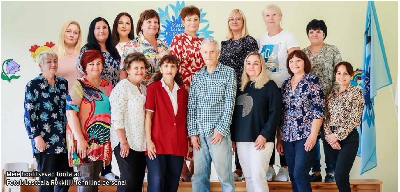
Meie hoolitsevad töötajad

Väga õiged on Agatha Christie sõnad: „Suurim õnn, mis