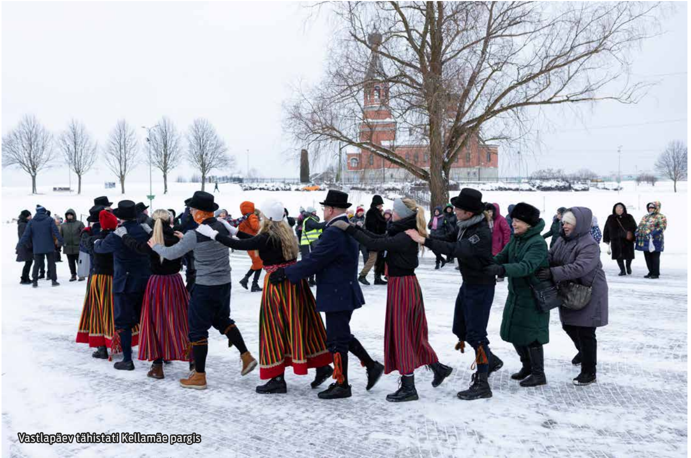
Vastlapäev tähistati Kellamäe pargis