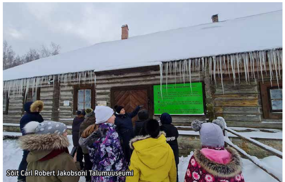
Sõit Carl Robert Jakobsoni Talumuuseumi

Koduteel tõdesime, et saime palju teada Eesti kultuuriloost ja traditsioonidest. Päev oli huvitav ja pakkus kõigile osalejatele palju rõõmu.