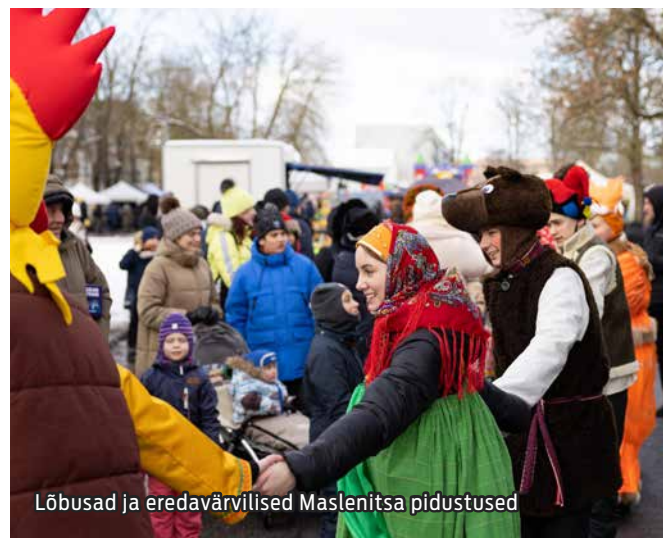
Lõbusad ja eredavärvilised Maslenitsa pidustused

Maardu Kultuuri- ja Infokeskuse poolt tänase kõiki pidustustest osavõtnuid ning ootame teid järgmisele Maardu vastlapäevale, mis toimub juba üsna varsti, 13. veebruar 2024 aastal.