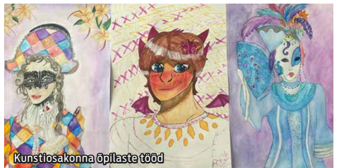
Kunstiosakonna õpilaste tööd