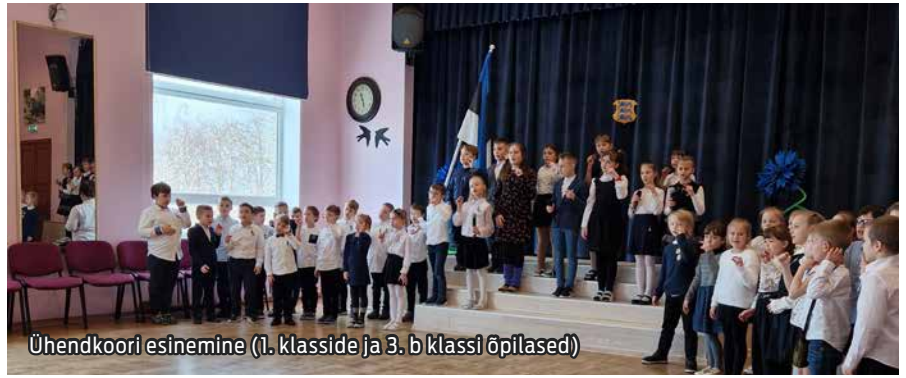
Ühendkoori esinemine (1. klasside ja 3. b klassi õpilased)

23. veebruaril oli tööpäev tavapärasest lühem ja tunde oli samuti vähem kui tavaliselt. Päev algas Eesti-teemalise klassitunniga ja lõppes meeldivalt ning pidulikult – kogu kool rivistus õue lipuheiskamiseks, misjärel suundusid kõik õpilased koju aastapäeva tähistama ja kevadvahetusega alustama.