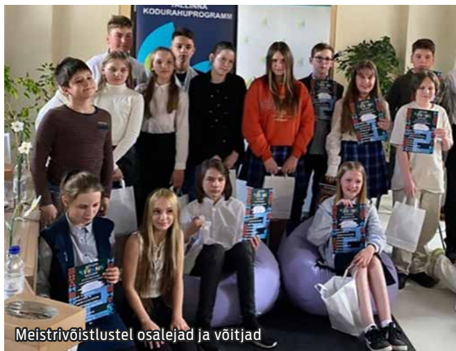
Meistrivõistlustel osalejad ja võitjad