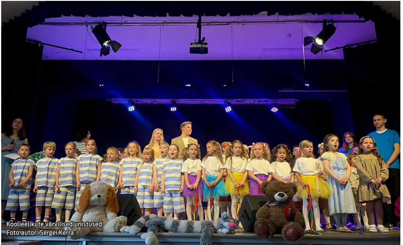
Koolieelikute värvilised unistused

26. aprillil toimus Maardu Vaba Aja Keskuse laval esimene koolieelikute loovusfestival "Värvilised unistused", mille korraldaja oli lasteade Rukkilill.