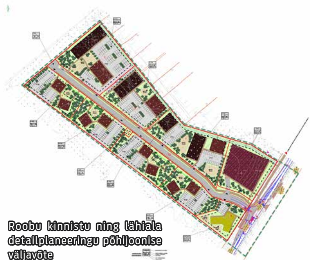
Roobu kinnistu ning lähiala detailplaneeringu põhijoonise väljavõte

Hetke seisuga on detailplaneering üldplaneeringu kohane. Uus detailplaneeringu lahendus näeb ette 11 kinnistu