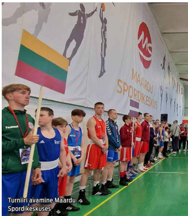
Turniiri avamine Maardu Spordikeskuses

42. korda saavutas võistkondliku esikoha Maardu pok-