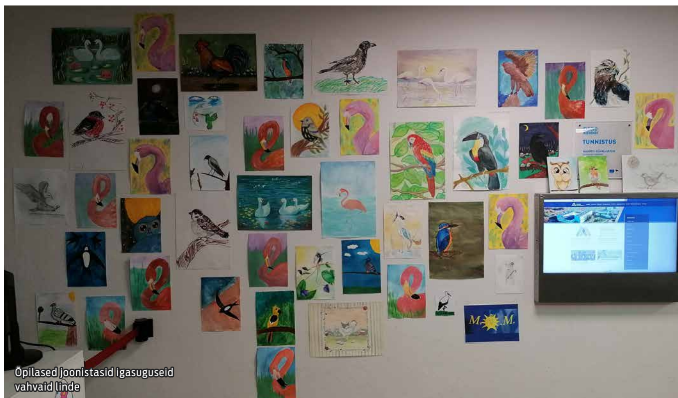
Õpilased joonistasid igasuguseid vahvaid linde