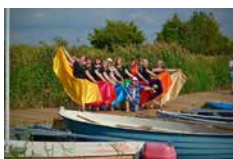
Tantsutrupp Kelmikad Mannikesed

Kauplejate registreerimine: https://bit.ly/muugapaevjalaat2023