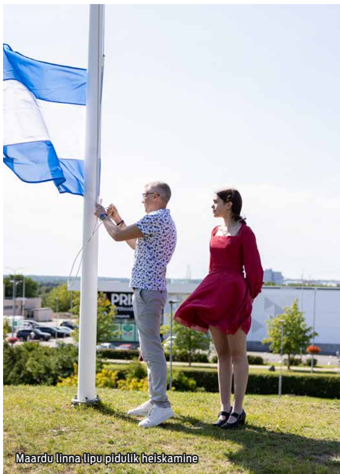
Maardu linna lipu pidulik heiskamine

Päikesepaistelisel laupäeval, 15. juulil, toimus Maardu linna 43. aastapäevale pühendatud pidustus. Meie kauni linna sünnipäeval said selle elanikud ja külalised osa erinevatest üritustest, mis algasid linnastaadionil ülelinnalise hommikuvõimlemisega ja jätkusid võrkpallivõistlustega Maardu Põhikooli staadionil. Põnevast võistlusvaimu täis turniirist võtsid osa lapsed ja täiskasvanud. Kümned maardulased alustasid oma päeva aktiivselt ja tervisele kasulikult.