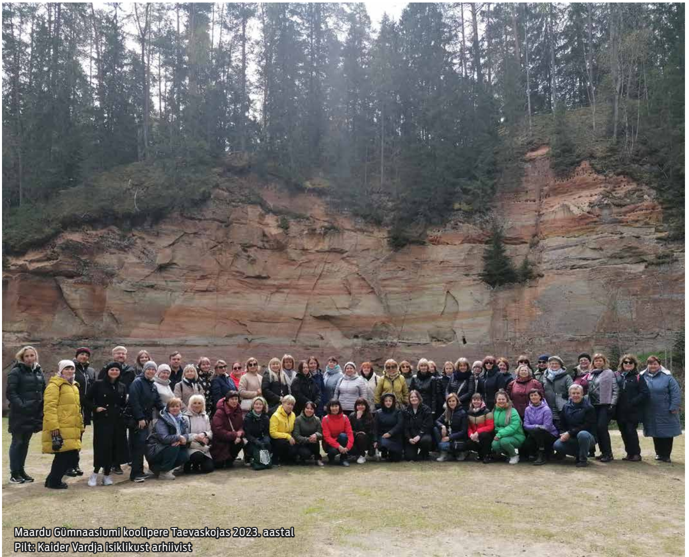
Maardu Gümnaasiumi koolipere Taevaskojas 2023. aastal

Meie õpetajad õpivad kursustel usinalt eesti keelt. Nüüd avanes võimalus keelerändele minekuks, st õpetaja läheb kolmeks nädalaks eestikeelse kooli ja hakkab keelementori toel õpetama sealseid klasse. Praegu on meil keelerändel kaks õpetajat, üks Põlvas ja teine Kuresaares. Tagasiside näitab, et selline keeleõppe meetod on motiveeriv ja tõhus. Väga suure huviga oodatakse meil kultuuriloolisi õppereise Eestimaal, kuhu oleme kaasanud kogu töötajaskonna. Meie koolis on väga tublid,