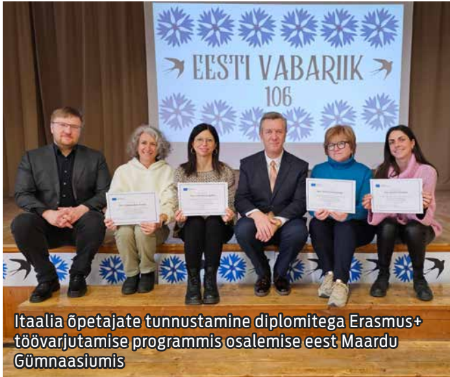
Itaalia õpetajate tunnustamine diplomitega Erasmus+ töövarjutamise programmis osalemise eest Maardu Gümnaasiumis

MATTHIAS VANAMB Maardu Gümnaasiumi arendusjuht