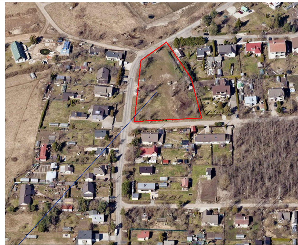
KOGRE TN 11A KINNISTU DETAILPLANEERINGUALA (ORINETEERUV PIIR)