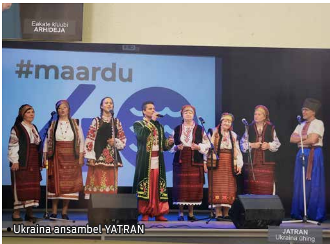
Ukraina ansambel YATRAN

Juba mitukümmend aastat rõõmustavad rahvalaulurühmad oma loominguga mitte ainult Maardu, vaid ka paljude teiste Eesti linnade elanikke, hoides kultuuripärandit ja kandes põlvest põlve edasi siirast armastust traditsioonide vastu. Nende esinemised ei ole lihtsalt kontserdid, vaid tõelised hingepeod, kus iga laul kõlab kui lugu, mis on täidetud esivanemate soojuse ja tarkusega.