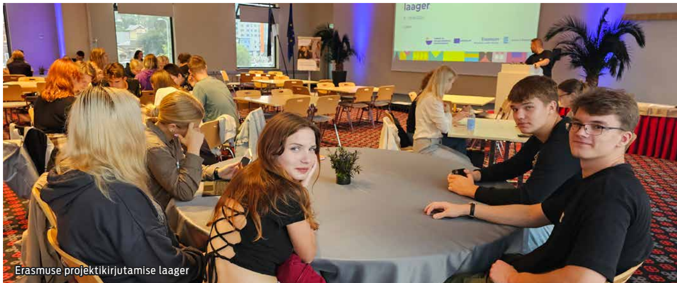
Erasmuse projektkirjutamise laager