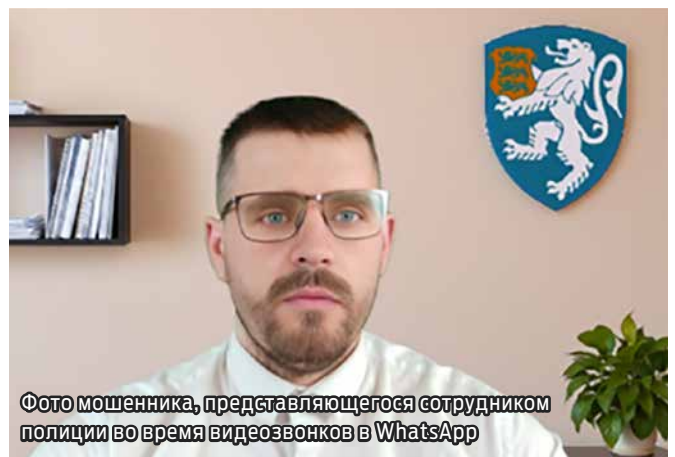
Фото мошенника, представляющего себя сотрудником полиции во время видеозвонков в WhatsApp

Сообщения о мошенничествах, включая скриншоты и записи звонков, присылайте в полицию по адресу kelmused@politsei.ee . Любая информация о возможном мошенничестве помогает нам бороться с такого рода международной преступностью.