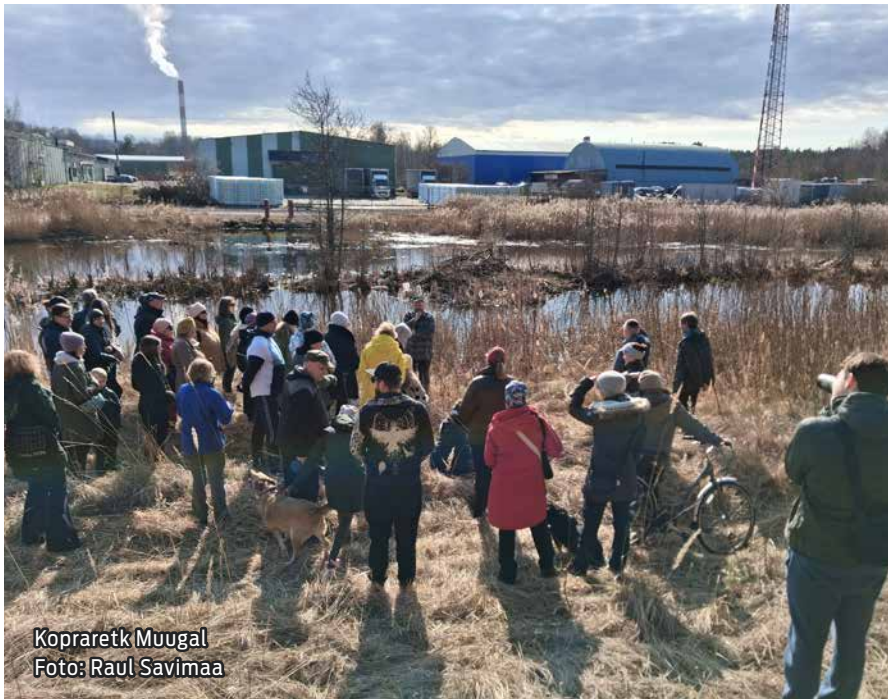
Kopraretk Muugal