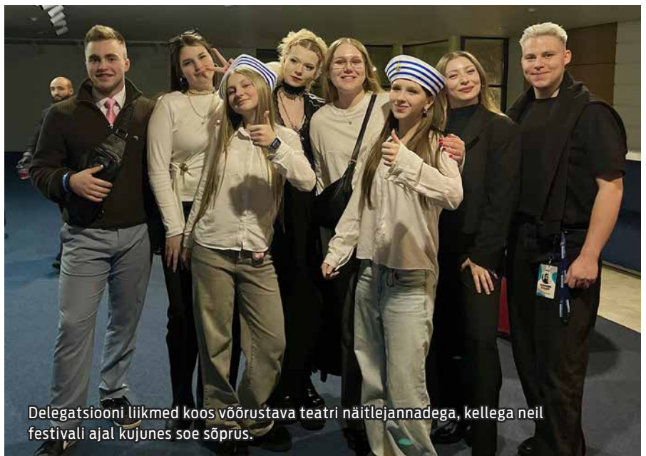
Delegatsiooni liikmed koos võõrustava teatri näitlejannadega, kellega neil festivali ajal kujunes soe sõprus.

Teater võtab alati rõõmuga vastu uusi osalejaid, kes on valmis arenema, õppima ja üheskoos teatriloomingu- ga tegelema. Kui olete huvitatud sellest, et ennast laval proovile panna ja noorteteatriga Veer & Špaga liituda, saatke palun e-kiri aadressile: artproject.vsh@gmail.com .