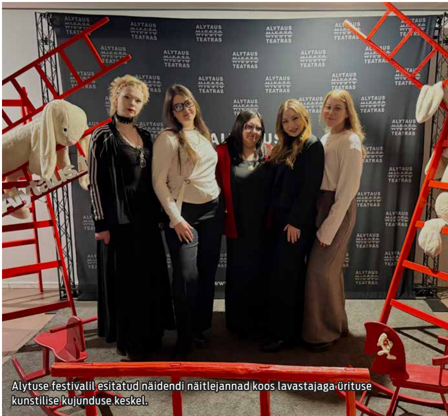
Alytuse festivalil esitatud näidendi näitlejannad koos lavastajaga ürituse kunstilise kujunduse keskel.