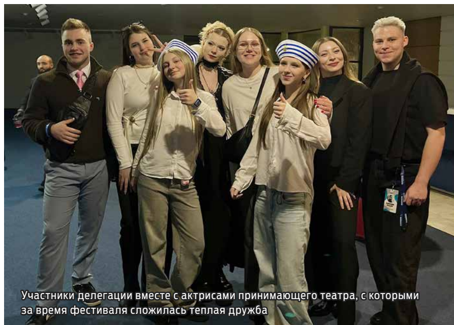
Участники делегации вместе с актрисами принимающего театра, с которыми за время фестиваля сложилась теплая дружба

Театр всегда рад новым участникам, готовым развиваться, учиться и заниматься театральным творчеством вместе. Если вы заинтересованы в том, чтобы попробовать себя на сцене и стать частью молодежного театра «Веер и Шпага», пишите на электронную почту: artproject.vsh@gmail.com .