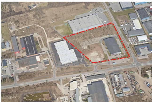
Foto 1 Vaade planeeringualale ja selle kontaktvööndile lõunasuunast. Planeeritav ala on märgitud punase joonega.

Vana-Narva mnt tööstuspiirkonnas on olemas ühistranspordiühendus, mis tagab liikumise nii Maardu linna siseselt kui ka ühenduse Tallinnaga. Lähim ühistranspordipeatus jääb ca 250 m kaugusele planeeringualast.