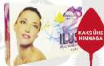
TERVISEPÜRAMIID I.L.U.S TABLETID

Pakkumised kehtivad ainult Maardu Südameapteegis kuni 31.12.2015