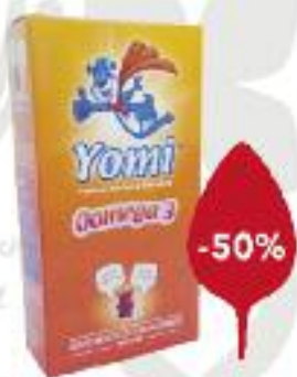
YOMI OMEGA-3 NÄRIMISTABLETID

Maardu Tervisekeskuse Südameapteek Haigla 2B, Maardu tel 602 0607 / E-P 9-17