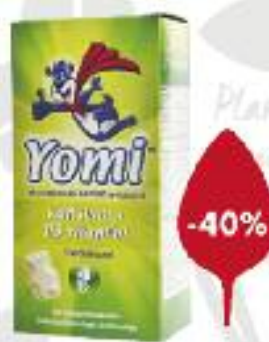
YOMI KALTSIUM+D3 NÄRIMISTABLETID