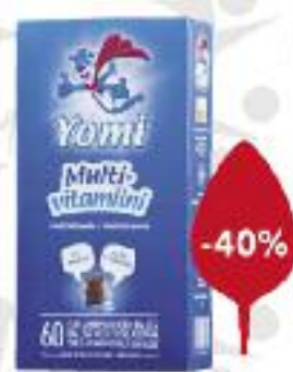
YOMI MULTIVITAMIIN NÄRIMISTABLETID