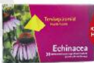
TERVISEPÜRAMIID ECHINACEA TABLETID